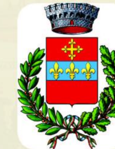
comune di chiusi della verna