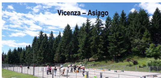
Vicenza – Asiago

SEI UN CENTRO E VUOI QUALIFICARE I TUOI OPERATORI ? CHIAMA IL 334 922 10 52