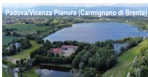
Padova/Vicenza Pianura (Carmignano di Brenta)